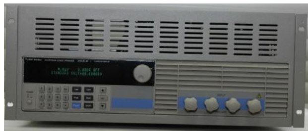
Модификации АТН-8180, АТН-8185, АТН-8240, АТН-8245