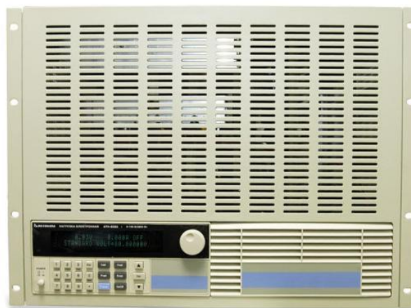
Модификации АТН-8360, АТН-8365, АТН-8366