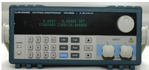
Модификации АТН-8030, АТН-8036

Нагрузка выполнена в виде моноблока со съемным сетевым шнуром питания. На передней панели расположены кнопки управления и задания параметров и режимов работы, цифровая клавиатура, дисплей, ручка регулировки, кнопка включения, входные гнезда (кроме АТН-8360, АТН-8365, АТН-8366). На задней панели расположены разъем RS232, разъем для подключения сетевого шнура, переключатель величины напряжения питания, входные клеммы, шестиконтактный разъем для подключения источника сигнала синхронизации и внешнего вольтметра, аналоговые выходы BNC1-out и BNC2-out (кроме АТН-8030).