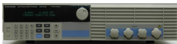
Модификации АТН-8060, АТН-8065, АТН-8120, АТН-8125