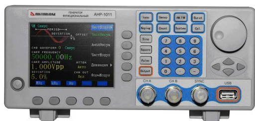
АНР-1011, АНР-1021, АНР-1031, АНР-1041

входной разъем сигнала запуска (для АНР-1016, АНР-1025, АНР-1035, АНР-1115, АНР-1150, АНР-1180, АНР-1250), разъем сетевого кабеля.