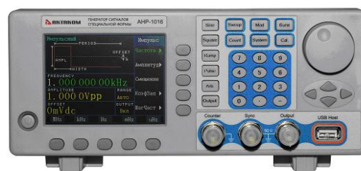
АНР-1016, АНР-1025, АНР-1035