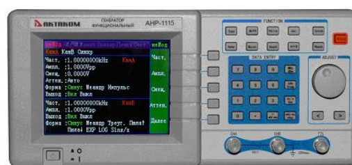
АНР-1115, АНР-1150, АНР-1180, АНР-1250