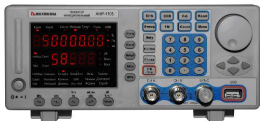
АНР-1105, АНР-1110, АНР-1120