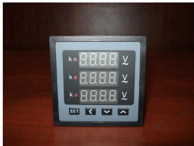
Прибор щитовой цифровой электроизмерительный ЦП-В72×3