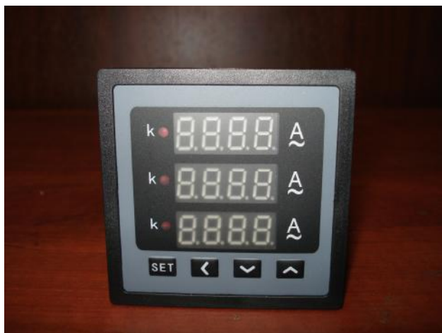
Прибор щитовой цифровой электроизмерительный ЦП-А72×3