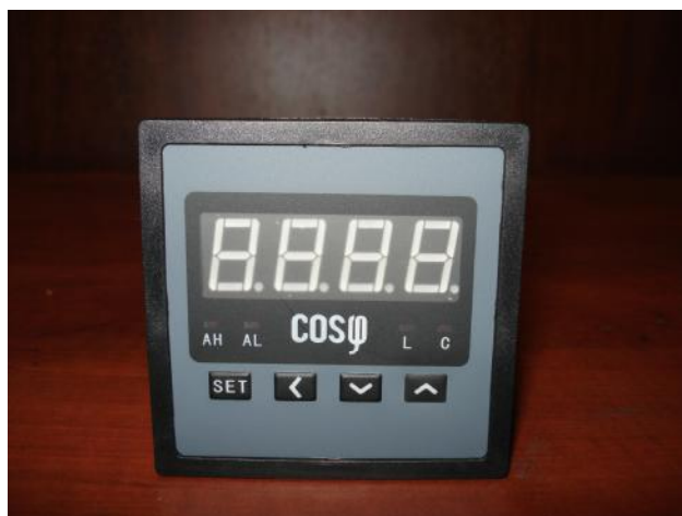
Прибор щитовой цифровой электроизмерительный ЦП-Ф72/1