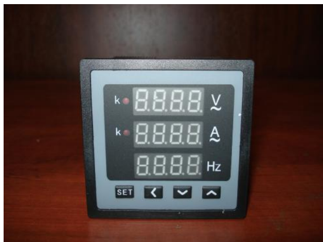
Прибор щитовой цифровой электроизмерительный ЦП-АВЧ72