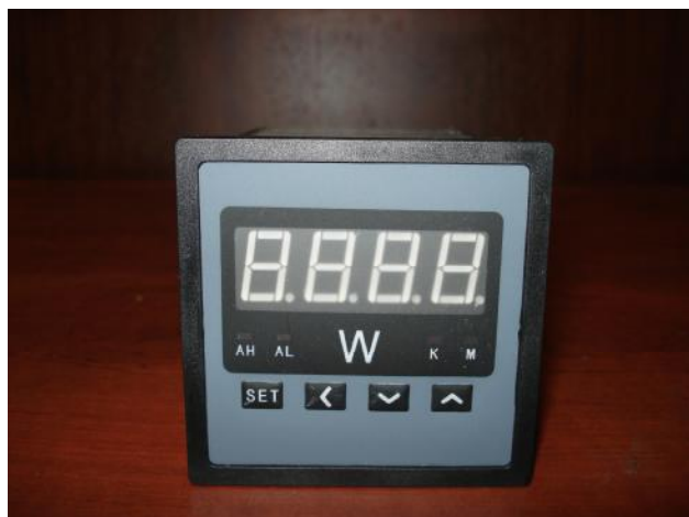
Прибор щитовой цифровой электроизмерительный ЦП-ВТ72/1