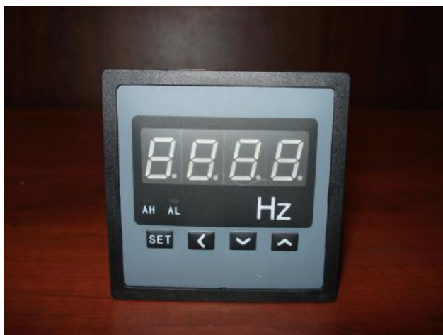
Прибор щитовой цифровой электроизмерительный ЦП-Ч72