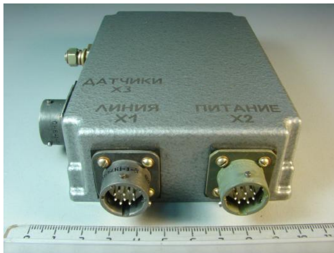
Рисунок 1 – Внешний вид блока БС-ДД

Режим работы – непрерывный, круглосуточный.