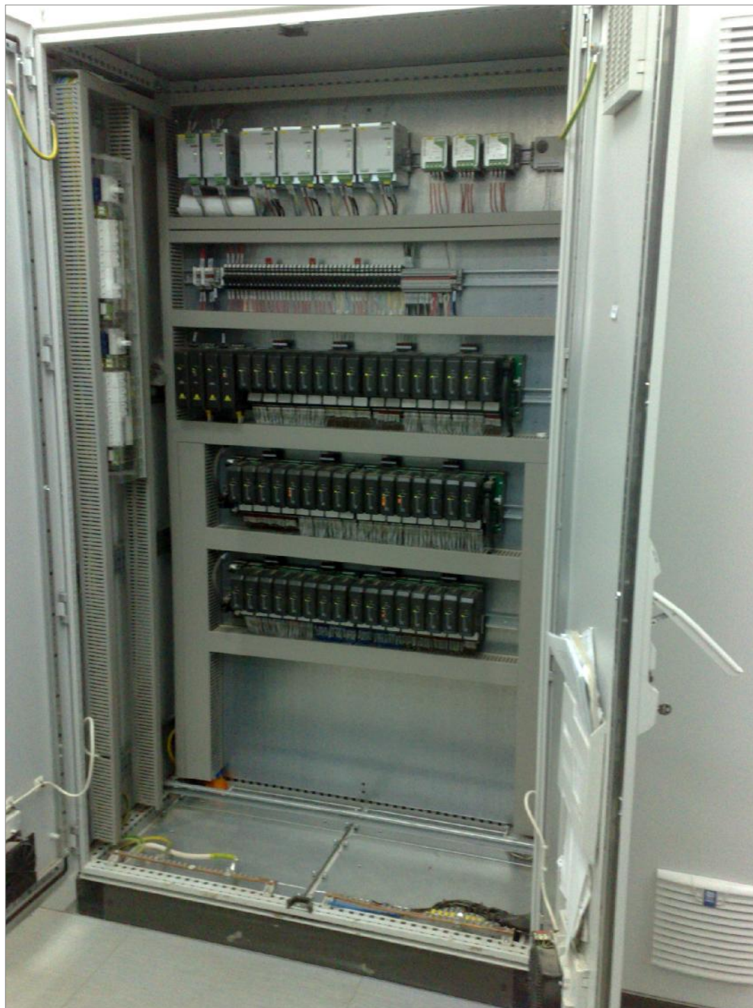
Рисунок 1 - Фото общего вида ПТК СПГК ООО «Афипский НПЗ»