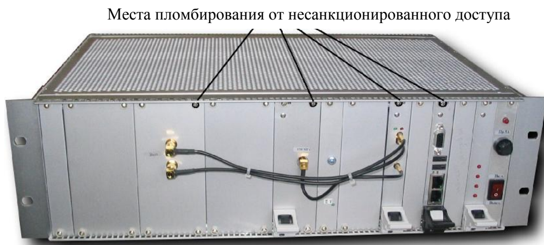
Рисунок 2 — Блок ЦРПУ-ОНЧ-ВЧ. Места установки пломб от несанкционированного доступа