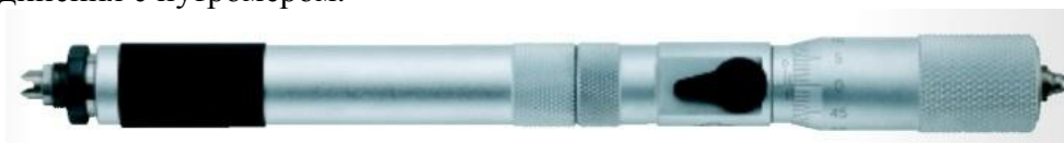
Рисунок 1. - Общий вид нутромеров микрометрических Micromar 44 CZ.

Для получения требуемых диапазонов измерений нутромер может комплектоваться удлинителями, которые представляют собой стальные стержни с резьбовыми муфтами на концах для соединения с нутромером.