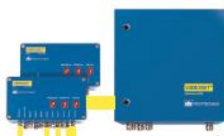
Рисунок 5 –Анализаторы вибрации модели VIBRONET SIGNALMASTER