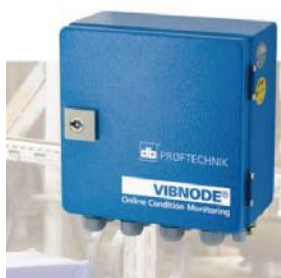
Рисунок 3 –Анализаторы вибрации модели VIBNODE