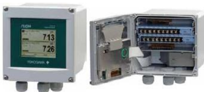
Рис. 1 Фотография общего вида электронного блока анализатора жидкости FLEXA модель FLXA21

Приборы устанавливают непосредственно на трубопроводах, возможен также настенный и щитовой их монтаж.