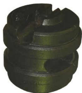
Рис. 5 Общий вид «Гиря ST 500 кг М 1-2 »