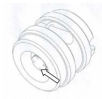
Рис. 6 Место пломбирования от несанкционированного доступа