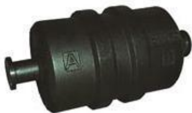
Рис. 1 – Общий вид «Гиря 500 кг класса M_{1-2} »

Все гири изготовлены из серого чугуна. Подгоночные полости гирь, заполнены технической дробью из чугуна по ГОСТ 11964. Общий вид гирь и место их пломбирования представлены на рис.1 ÷ 6.