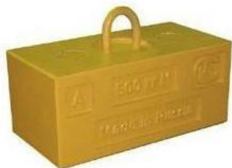
Рис. 3 Общий вид «Гиря МТ 500 кг М 1-2 »