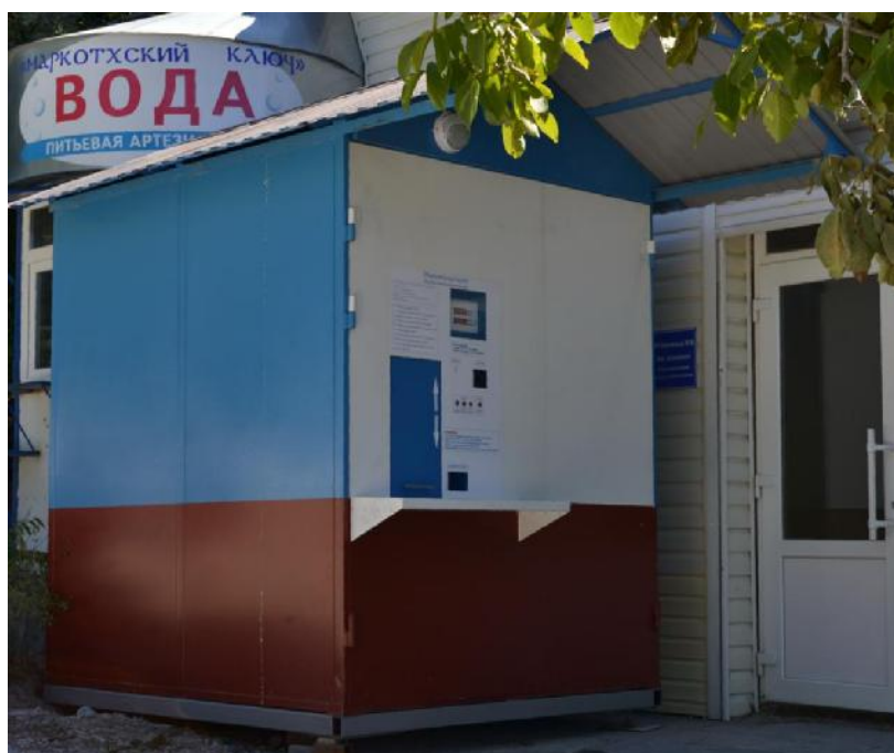
Рисунок 1. Общий вид автомата КПК-01