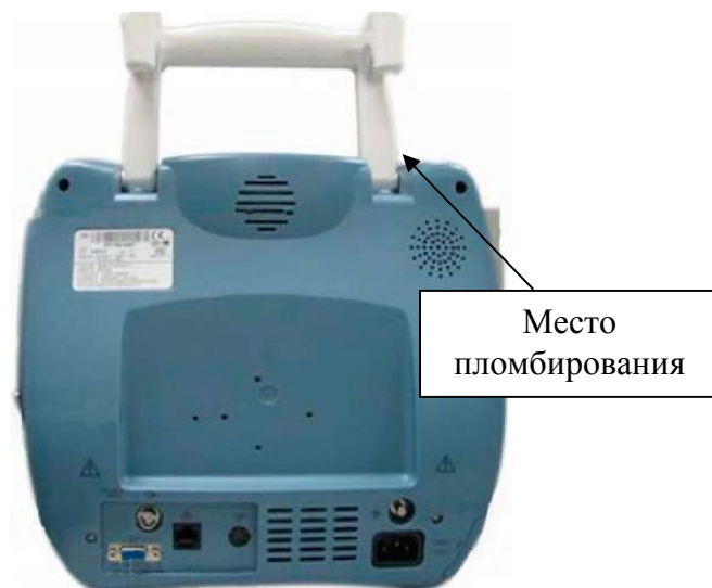
Рисунок 4. Монитор пациента модели PM-7000. Вид сзади.