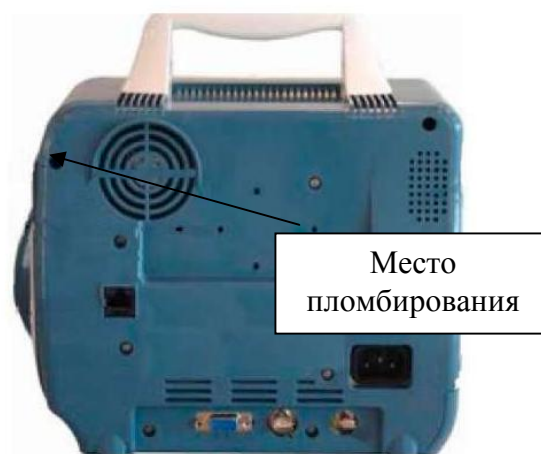
Рисунок 6. Монитор пациента модели PM-8000 Express. Вид сзади.