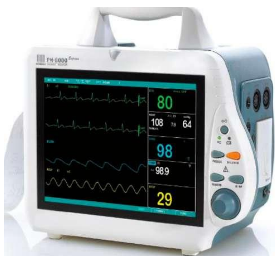
Рисунок 5. Внешний вид монитора пациента модели PM-8000 Express.