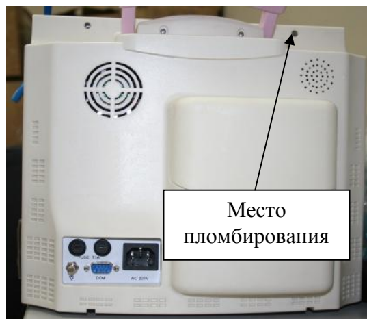
Рисунок 2. Монитор пациента модели iPM-9800. Вид сзади.