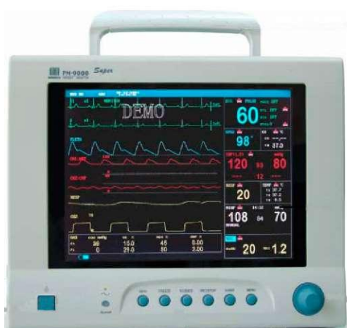
Рисунок 7. Внешний вид монитора пациента модели PM-9000 Express.