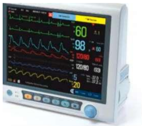
Рисунок 1. Внешний вид монитора пациента модели iPM-9800.