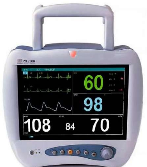
Рисунок 3. Внешний вид монитора пациента модели PM-7000.