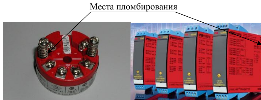
Рис.3 Внешний вид преобразователей измерительных PR серии 6.