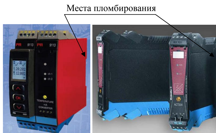
Рис.4 Внешний вид преобразователей измерительных PR серии 9.