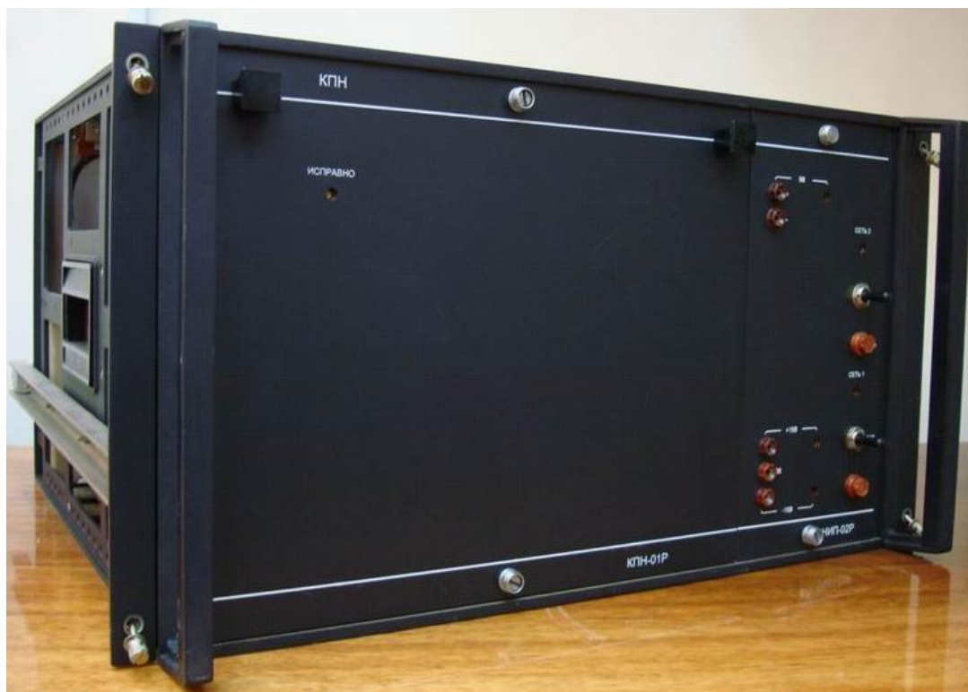
Рисунок 1 – Внешний вид блока КПН-01Р

Общий вид блока, места пломбирования и нанесения знака утверждения представлены на рисунках 1 и 2 соответственно