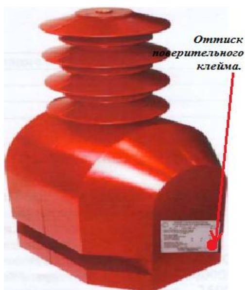
Рисунок 2 - Внешний вид трансформаторов ЗНОЛ