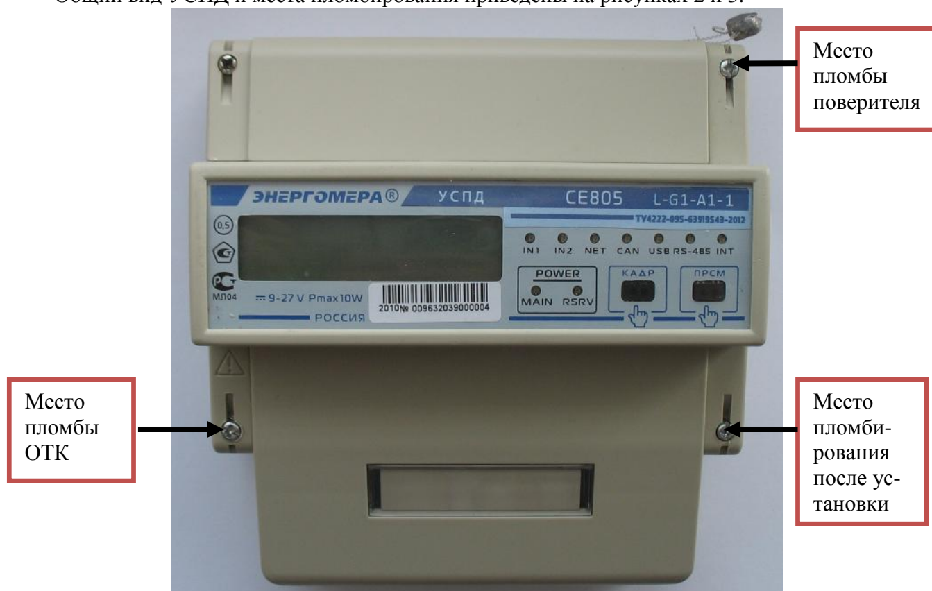
Рисунок 2 – Общий вид и места пломбирования УСПД модификаций CE805 X-XX-XX-1

Общий вид УСПД и места пломбирования приведены на рисунках 2 и 3.