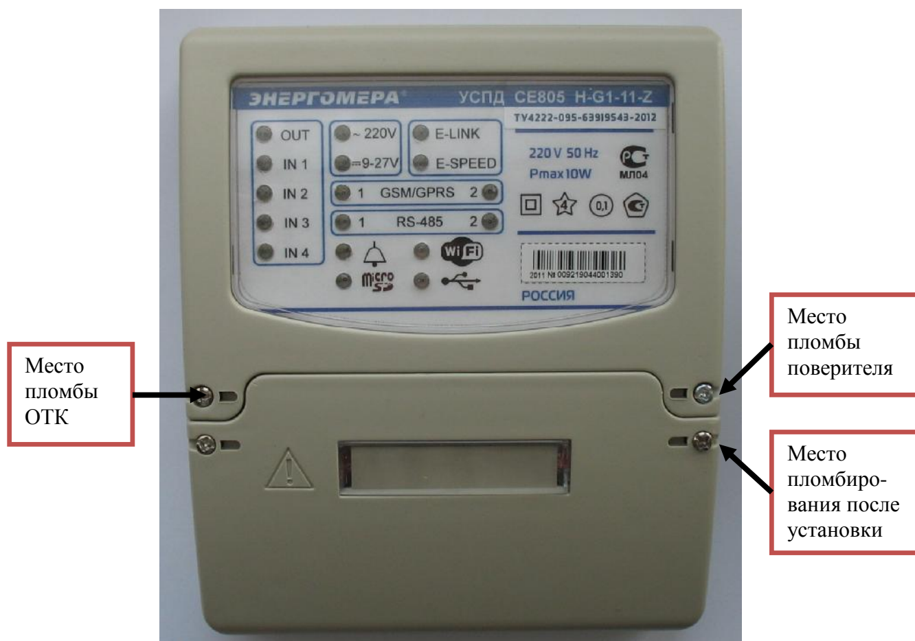
Рисунок 3 – Общий вид и места пломбирования УСПД модификаций CE805 X-XX-XX-Z