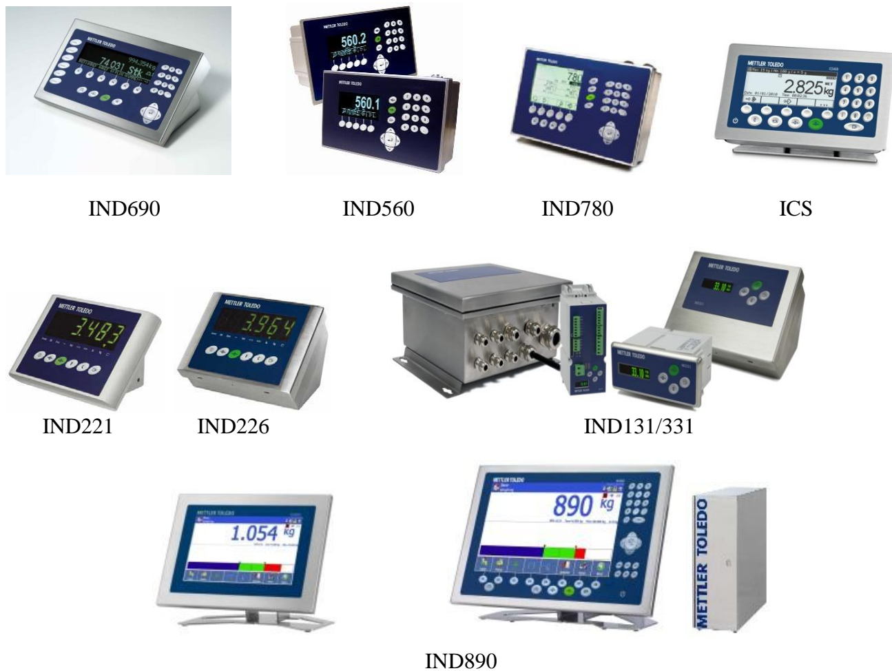
Рисунок 2 - Общий вид весовых терминалов

Места пломбировки весовых терминалов и встроенных в ГПУ АЦП, исключая несанкционированные настройки и вмешательства, которые могут привести к искажению результатов измерений весов, показаны на рисунках 3 и 4.