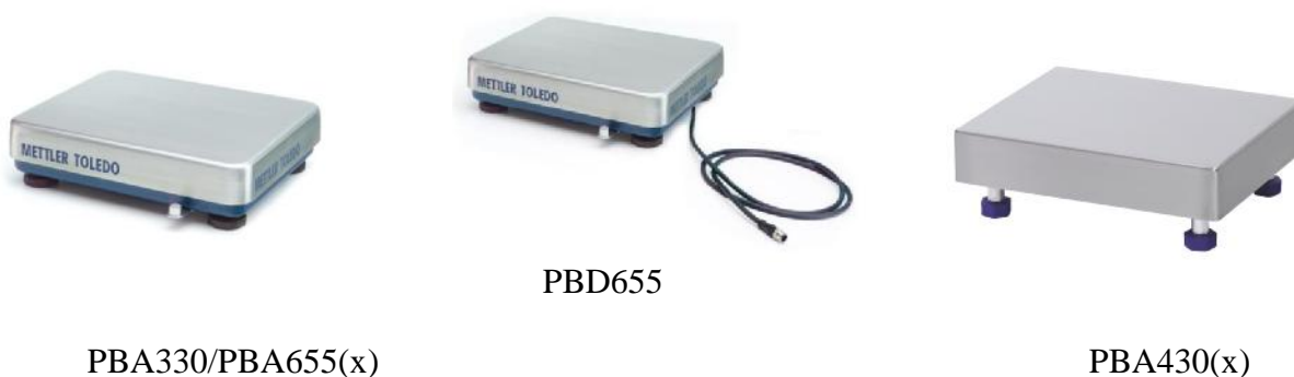
Рисунок 1 – Внешний вид ГПУ весов

Общий вид ГПУ и терминалов показан на рисунке 1 и 2 соответственно.