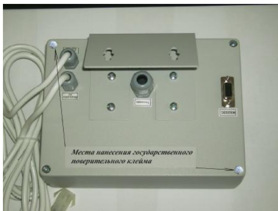
Рисунок 4 – Место нанесения пломбы

Весы выпускаются в восьми модификациях, отличающихся максимальной (Max) и минимальной (Min) нагрузками, дискретностью ( d ) и поверочным делением ( e ) (здесь и далее терминология приведена в соответствии с ГОСТ Р 53228-2008 «Весы неавтоматического действия. Часть 1. Метрологические и технические требования. Испытания»), а также массой и габаритными размерами, и имеют обозначение 4ДНИ-L/B-MD-A , где: