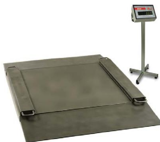
Рисунок 2 – Общий вид весов с платформой с пандусами для наезда тележек с грузом