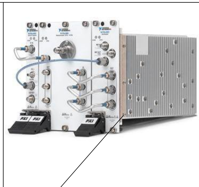
место пломбирования фотография 2. NI PXIe-5665