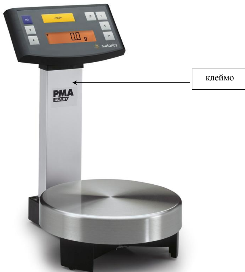
Рис. 2 – Весы электронные PMA 7501

Фотография внешнего вида весов представлена на рисунке 2