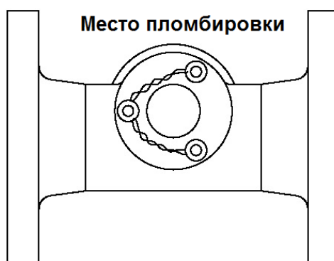
Рисунок 2 - Место пломбировки ППРТ

На рисунке 2 показан способ пломбирования ППРТ.