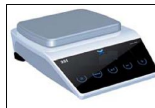
группа С, группа D, группа G