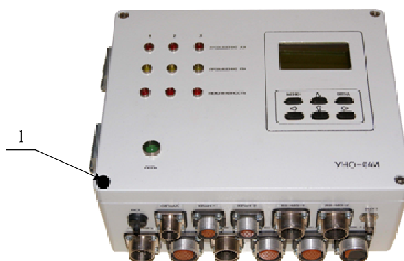
1 – Пломбы с оттиском клейма поверителя Рисунок 2 – Общий вид блока УНО-04И