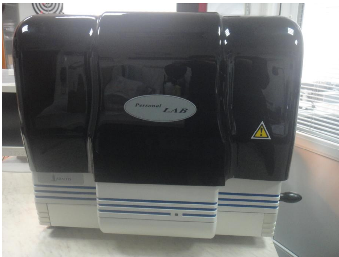
Рисунок 1 – Общий вид анализатора

Управление и обработка результатов измерения анализатора производится с внешнего ПК