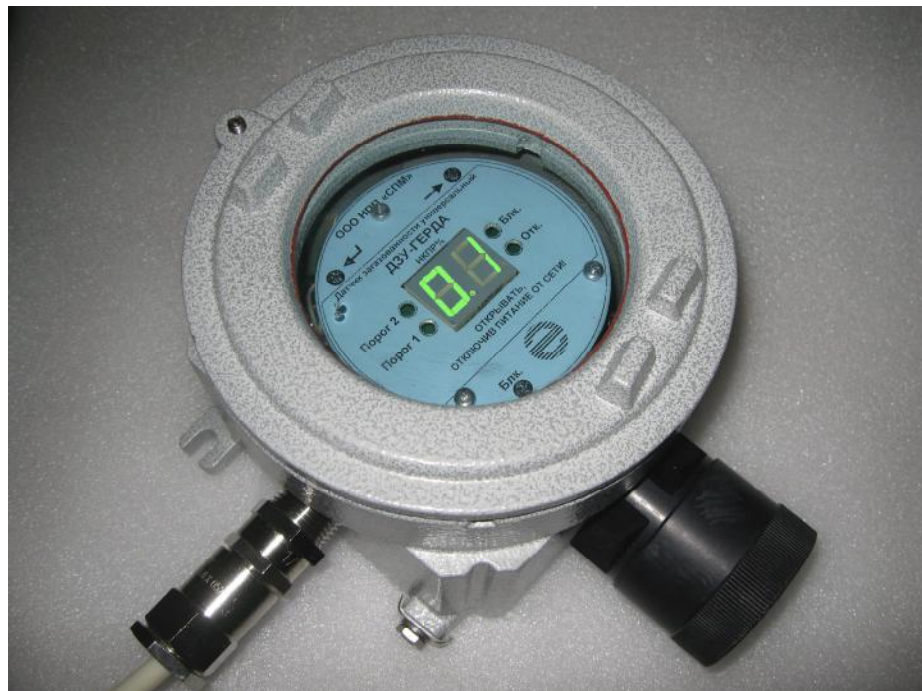
Рис1. Общий вид датчиков загазованности универсальных ДЗУ-ГЕРДА.

Выпускаются два исполнения датчиков общепромышленное и взрывозащищенное с маркировкой взрывозащиты 1 Ex d IIC T4 со шкалами в % НКПР и % объемной доли. Общий вид датчиков представлен на рис. 1.