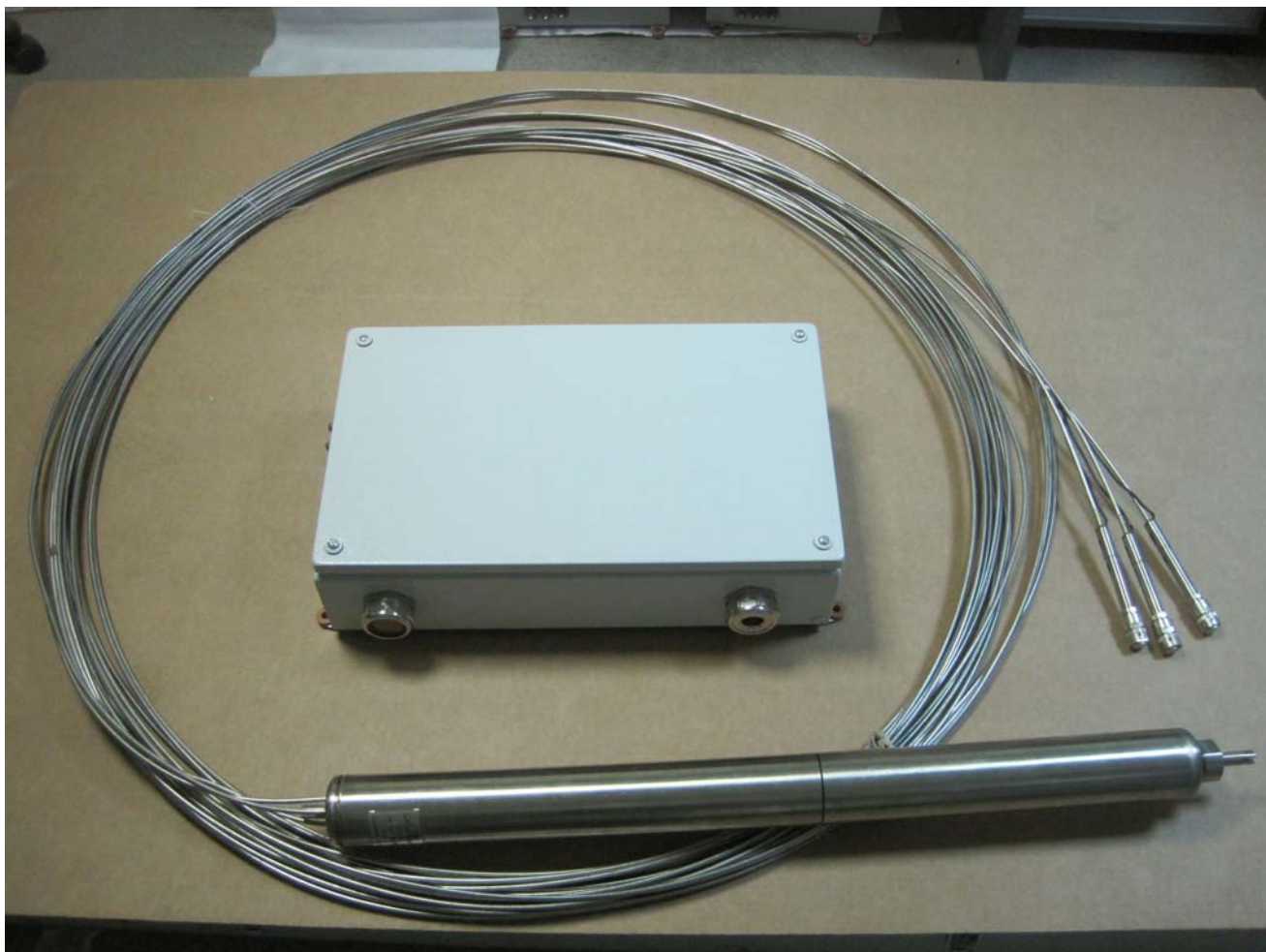
Рисунок 1 – общий вид УДПН