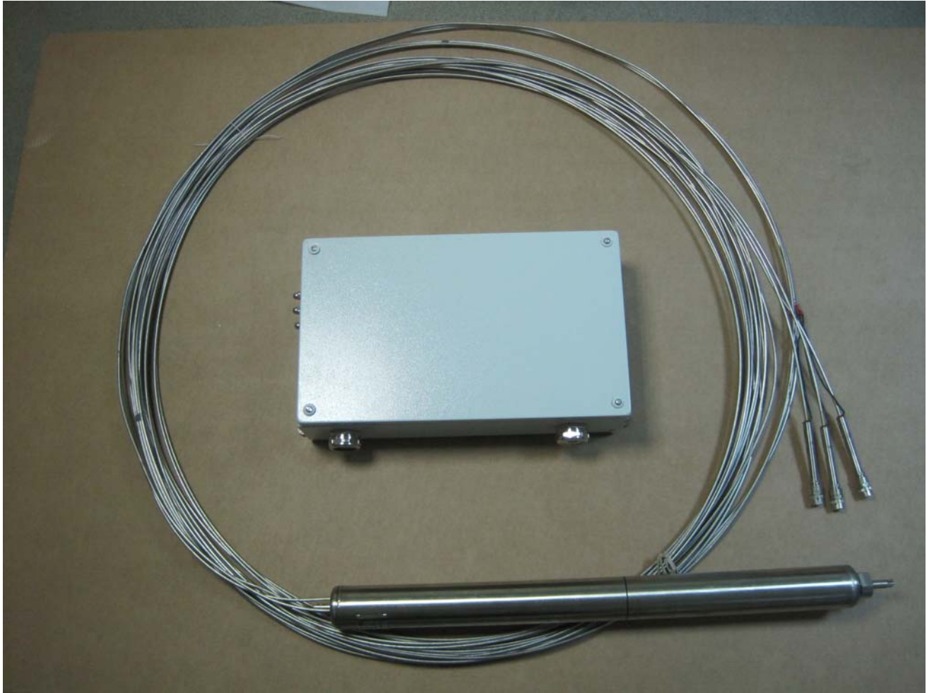
Рисунок 1 – общий вид УДПН