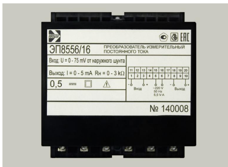
Рисунок 1 – Общий вид ИП

Схема пломбировки от несанкционированного доступа и указание мест для нанесения оттиска клейма ОТК и оттиска знака поверки средств измерений (далее - Знак поверки) на ИП приведены на рисунке 2.