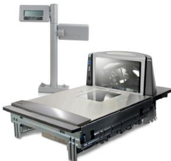
Рисунок 3 – Общий вид весов