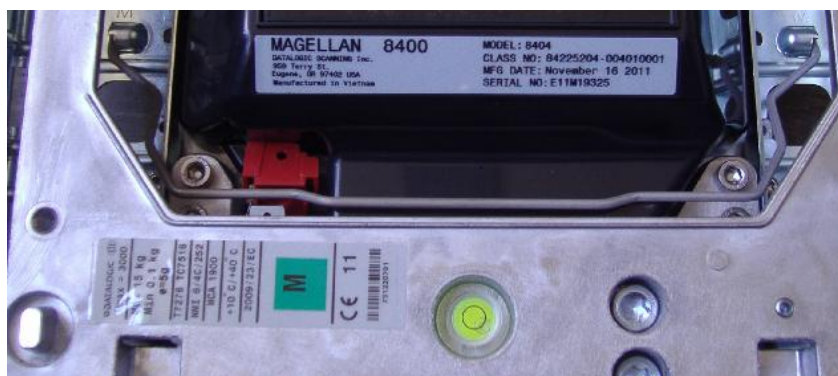
Рисунок 4 –Маркировка весов

Маркировка весов производится на фирменных наклейках, где указывается (Рис. 4):