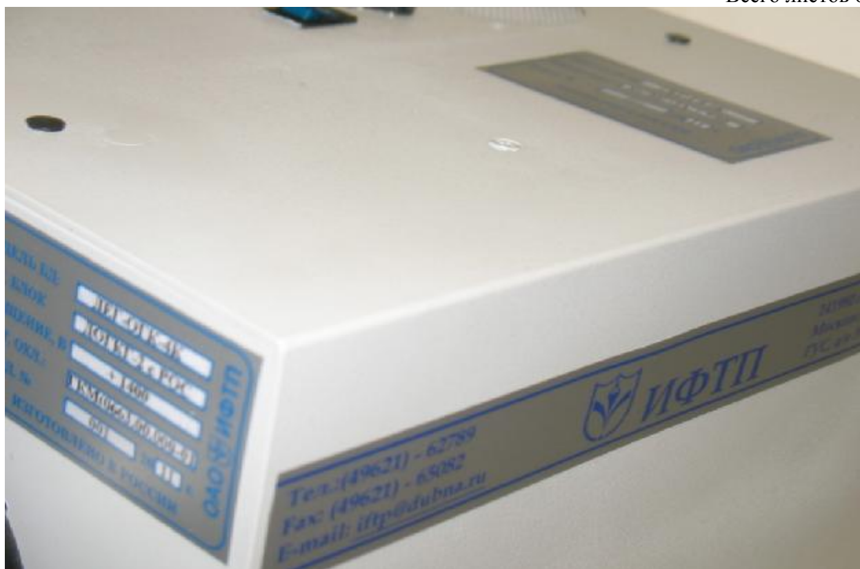
Рисунок 2 – Защита спектрометра энергий гамма-излучения полупроводникового с микрокриогенной системой охлаждения СЕГ-ГЗ-4К от несанкционированного доступа