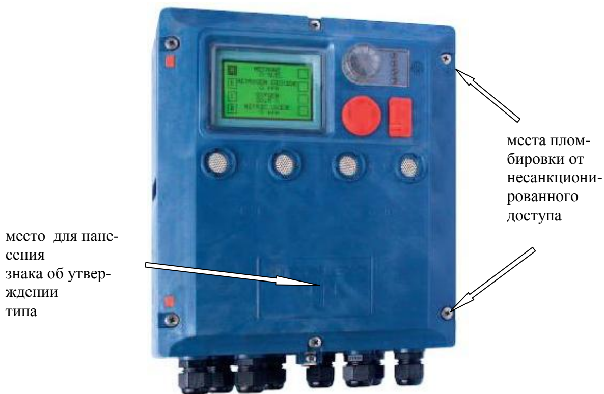
Рисунок 1 – Общий вид системы (модель SENTRO 8)