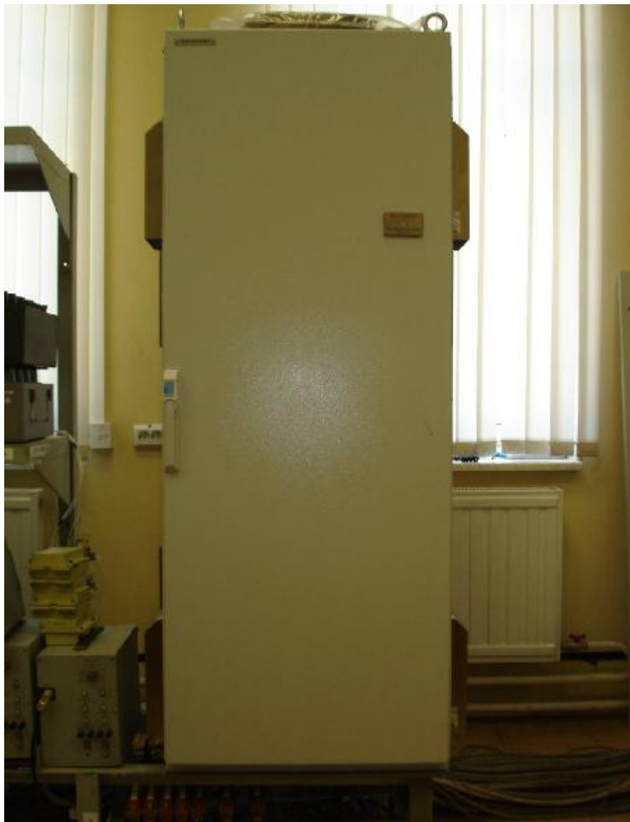
Рисунок 1 – Общий вид конструктива приборов А1(2)СLА01ЕG011...016, А1(2)СLА01ЕG021, 022 и А1(2)СLА01ЕC001...003 с закрытой дверью

Внешний вид модуля с указанием мест пломбировки клеймом ОТК приведен на рисунке 8.