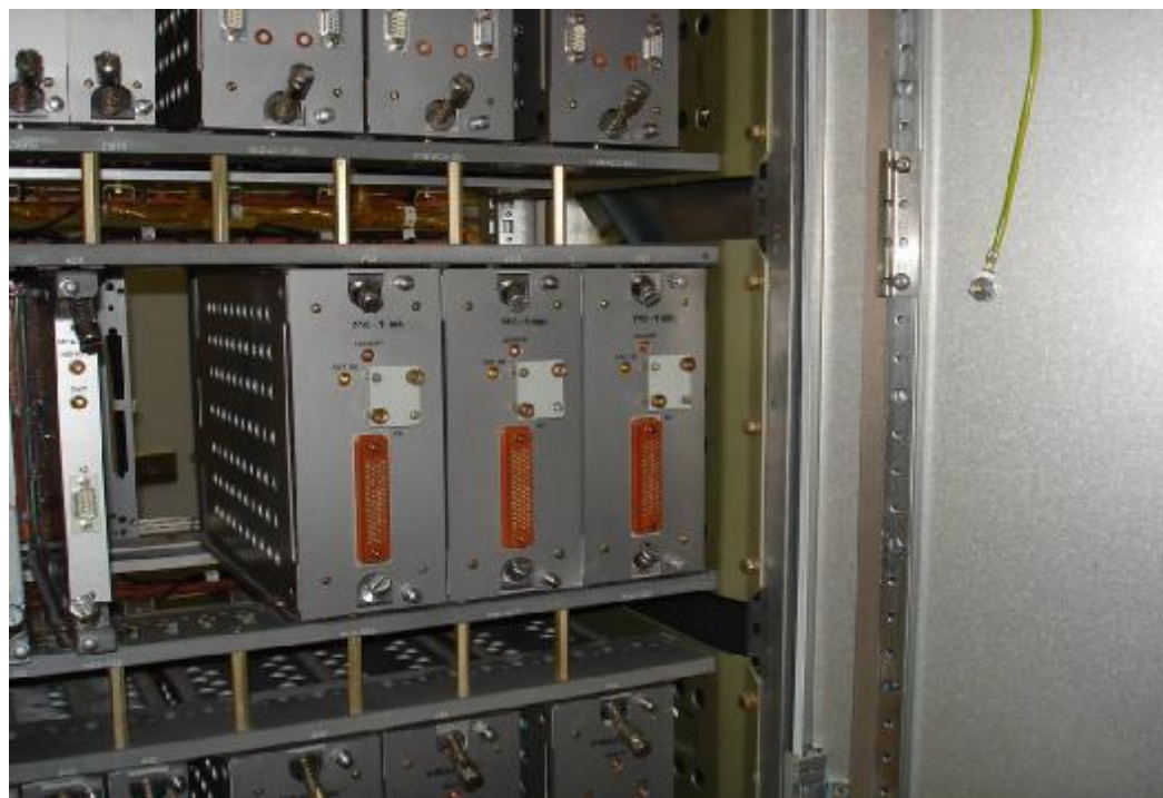
Рисунок 5 — Размещение модулей МК-1-004 и МСА в приборах КТП А1(2)СLА01ЕG0211, EG022