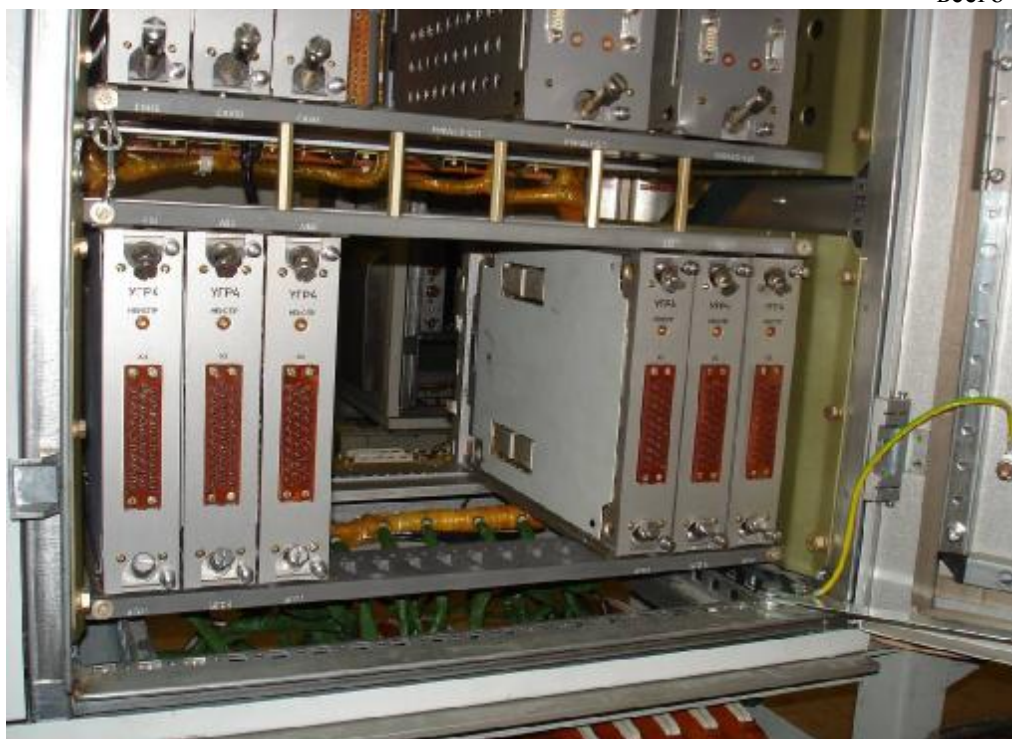
Рисунок 4 — Размещение модулей УГР4 в приборах КТП А1(2)СLА01ЕG021, 022