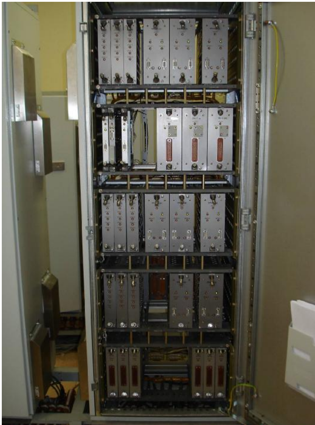
Рисунок 6 — Компоновка приборов КТП А1(2)СLА01ЕG021, 022