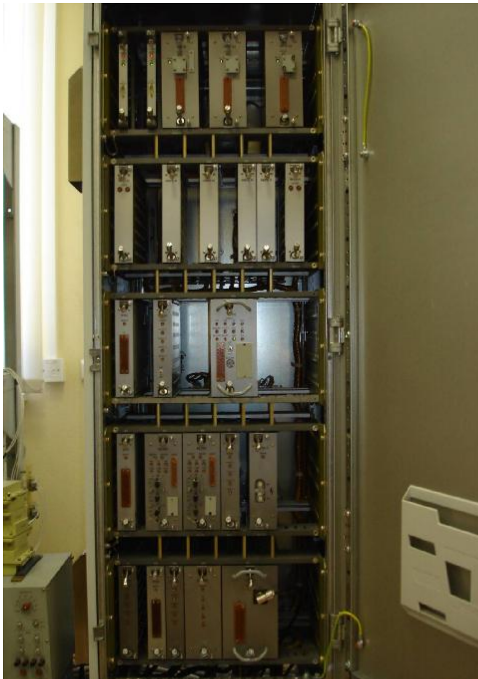
Рисунок 7 — Компоновка приборов КМТ А1(2)СЛА01ЕГ011...ЕГ016