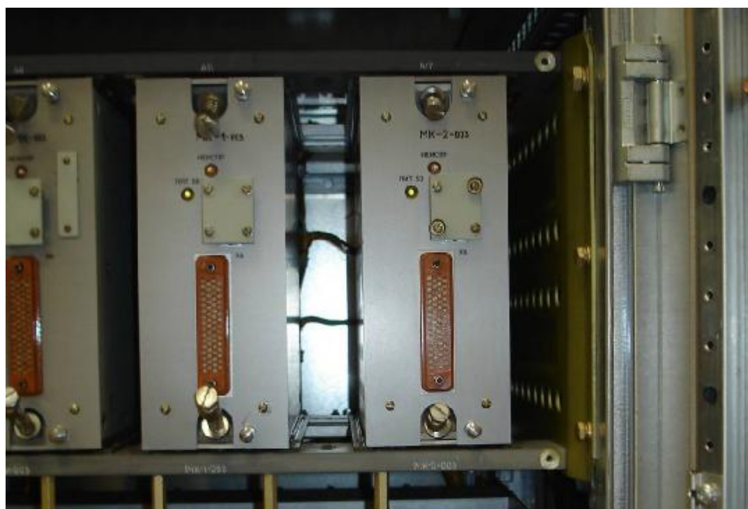
Рисунок 3 — Размещение модуля МК-2-003 в приборах КМТ А1(2)СLА01ЕG011...ЕG016