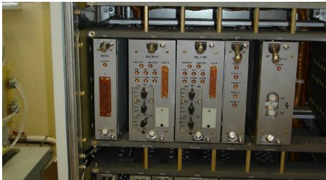
Рисунок 2 — Размещение модулей ФСТМ1 и УГР4 в приборах КМТ А1(2)СLА01ЕG011...ЕG016