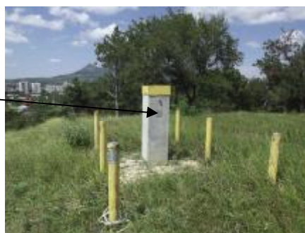
Рисунок 1 - Внешний вид пункта Базиса