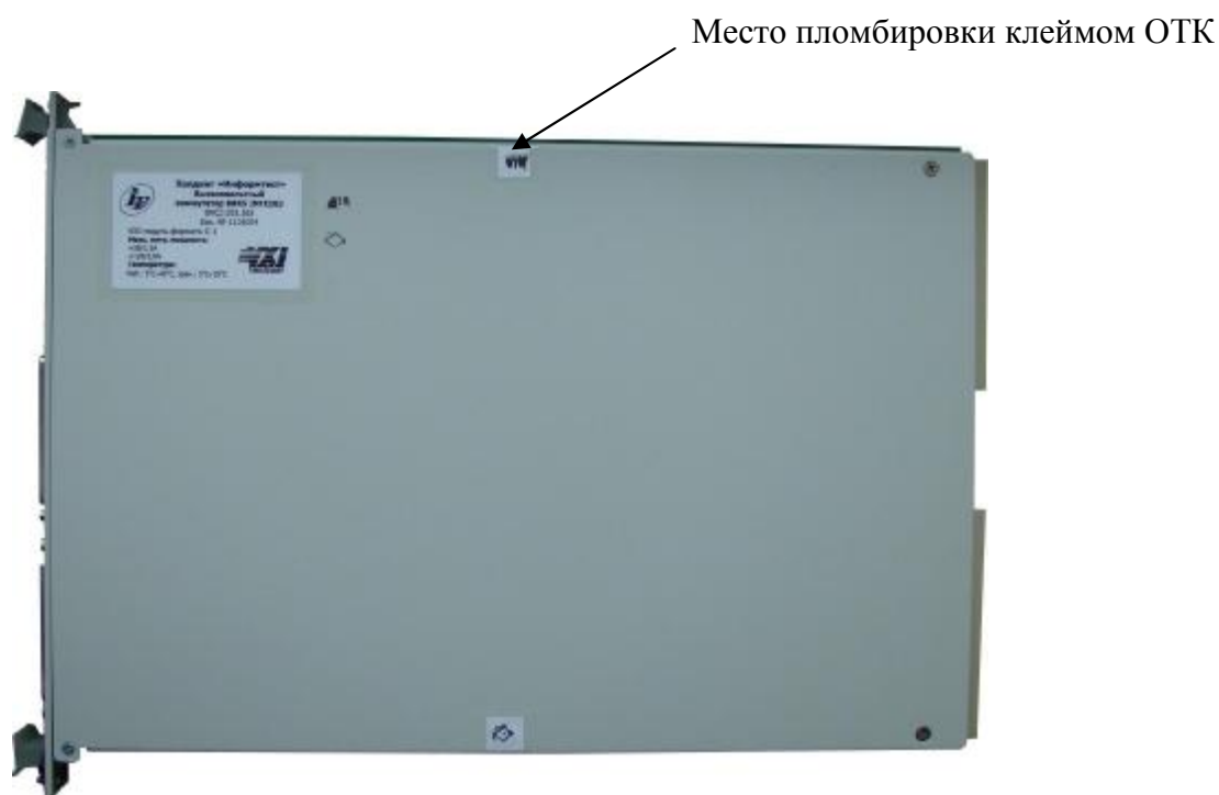
Рисунок 3 –Пломбировка функционального модуля