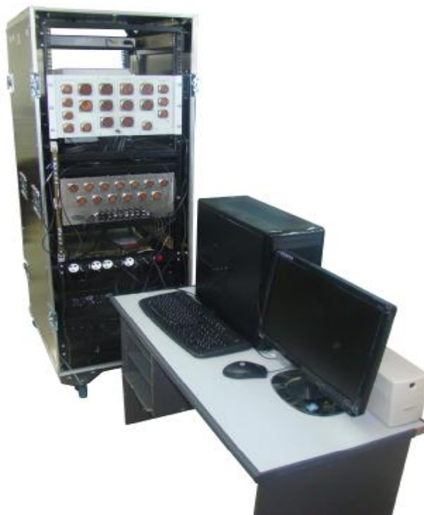
Рисунок 1 – Внешний вид СУ-1101 со стороны коммутационных панелей

Защита от несанкционированного доступа предусмотрена в виде пломбировки функциональных модулей, установленных в крейт (рисунок 3).