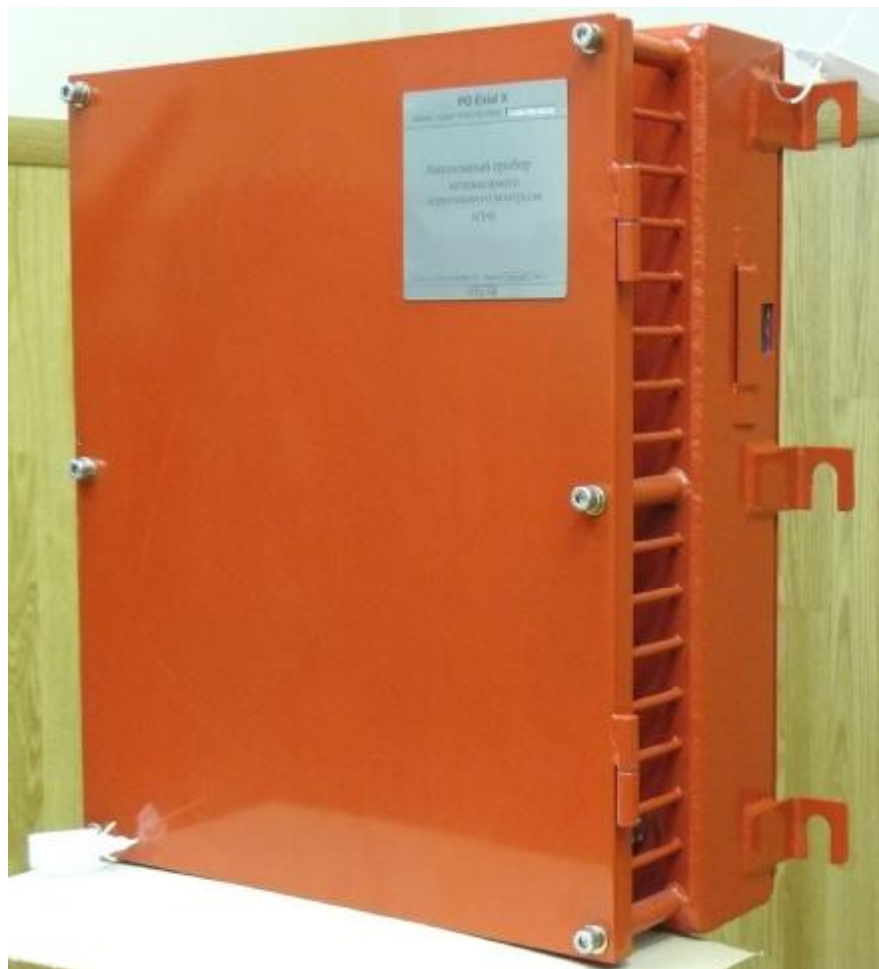
Рисунок 4 – АПНК. Отсек датчиков с закрытой крышкой

Ввод питания и вывод информационных сигналов осуществляется через кабельные вводы коробки клеммной, расположенной в отделении датчиков.