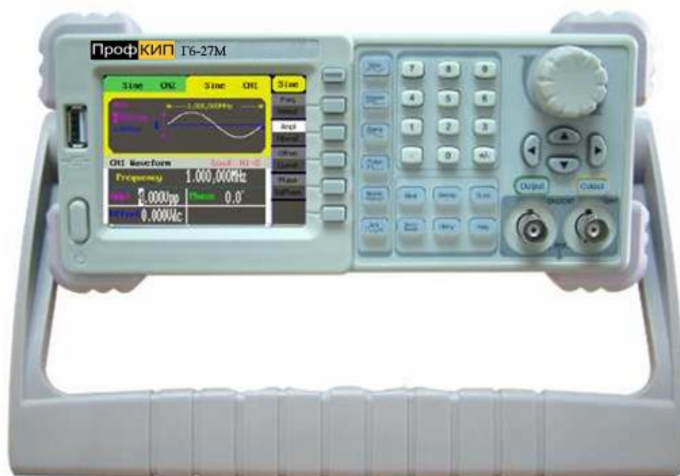
Рисунок 1 – Общий вид генератора

Генераторы представляют собой лабораторные многофункциональные измерительные приборы, принцип действия которых основан на технологии прямого цифрового синтеза, который позволяет получать стабильные, высокоточные сигналы с низким коэффициентом нелинейных искажений практически любой формы. На передней панели генератора находится цветной жидкокристаллический дисплей, состоящий из двух частей: в верхнем окне отображается форма генерируемого сигнала, в нижнем окне – его параметры. Справа от дисплея находится вертикальный ряд кнопок меню, с помощью которых пользователь может ввести меню различных генерируемых функций, и ряд кнопок, используемых при генерации стандартных форм сигналов. В нижней части панели расположены выходные разъемы двух каналов и кнопки, используемые при выборе функций модуляции. Для ввода цифровых параметров на панели имеется три группы органов управления: кнопки направлений (со стрелками), вращающийся регулятор параметров и цифровая клавиатура.