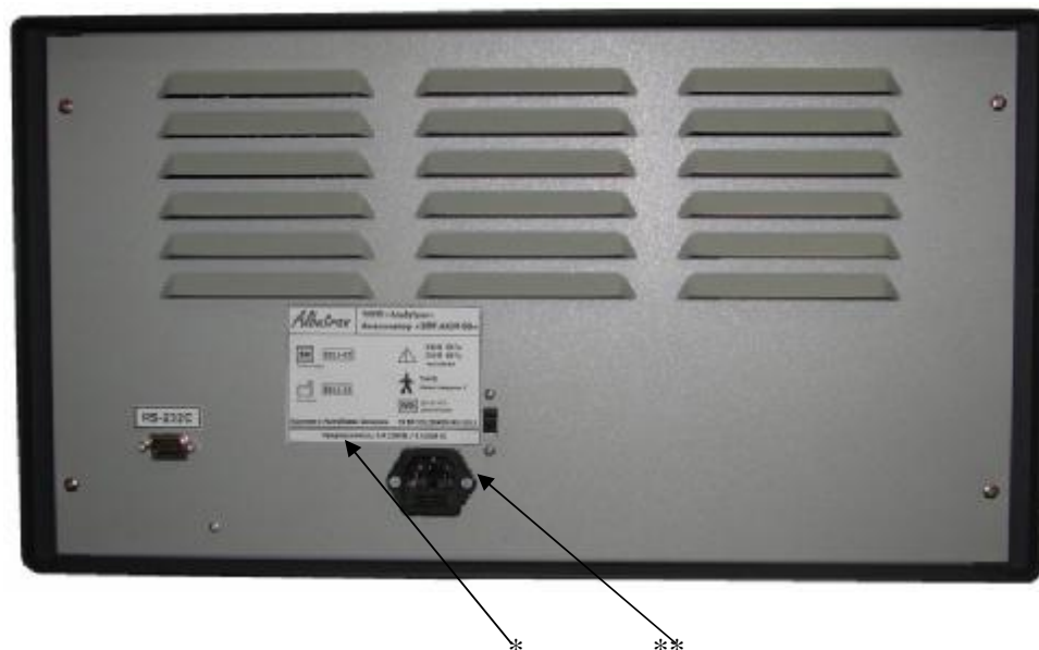
Рисунок 2 – задняя панели, *-место маркировки, **-место пломбировки