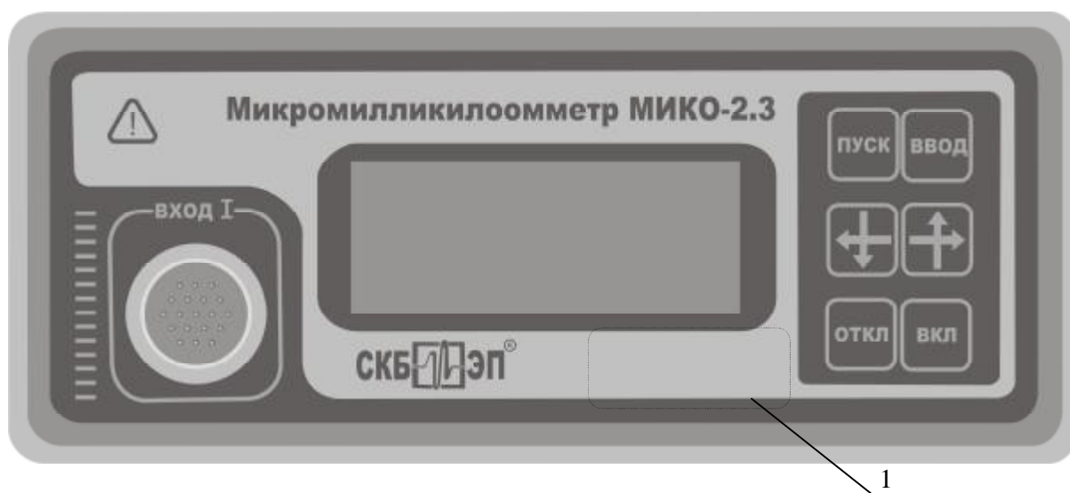
Рис. 2. Схема панели

1. Место для нанесения оттисков клейм или размещения наклеек.