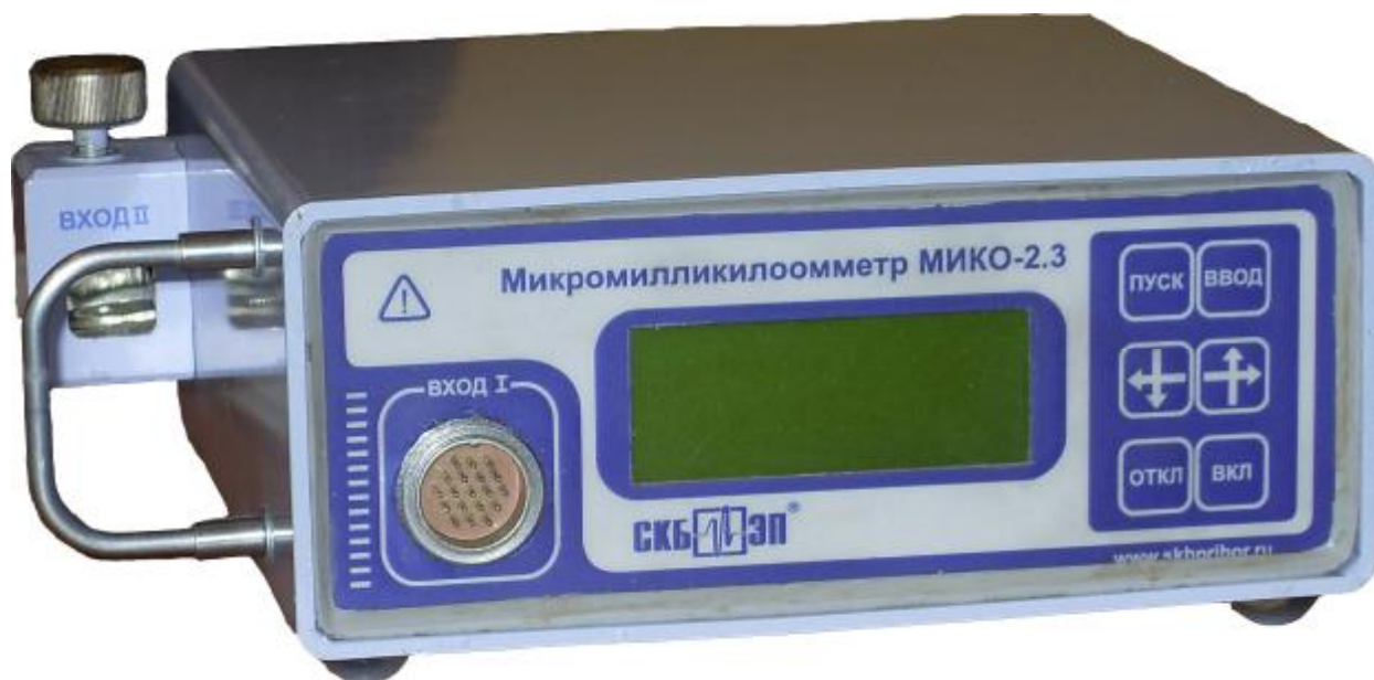
Рис. 1 Измерительный блок

Программное обеспечение не оказывает влияния на метрологические характеристики прибора.