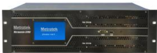
Рисунок 1 Общий вид источников отдельных версий (продолжение)