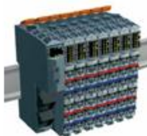
Общий вид контроллера CE1000 с модулями ввода/вывода