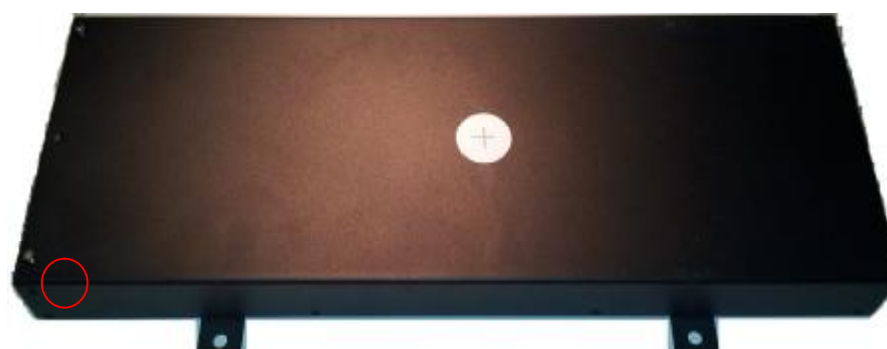
Рисунок 1 – Общий вид Устройства детектирования УДБГ-01СА