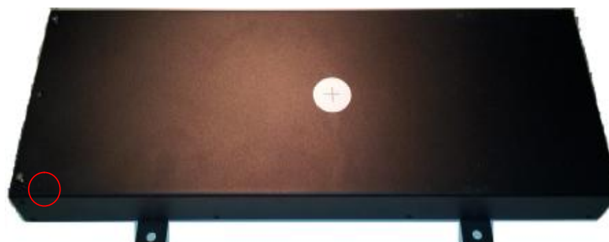
Рисунок 2 – Общий вид Устройства детектирования УДБГ-01СА-01