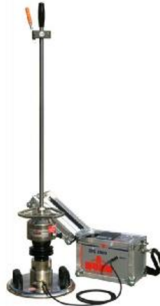
Рисунок 2 – Zorn ZFG 3000 GPS

Место пломбирования от несанкционированного доступа расположено на задней стороне электронного блока на винте крепления корпуса. Это место одновременно является местом нанесения оттиска клейма при поверке (рисунок 3).