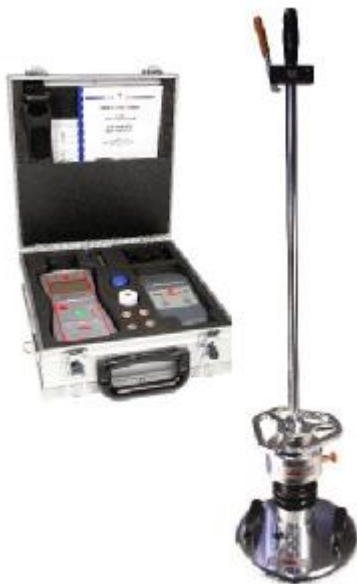
Рисунок 1 – Zorn ZFG 3.0 GPS

Внешний вид измерителей представлен на рисунке 1 и 2.