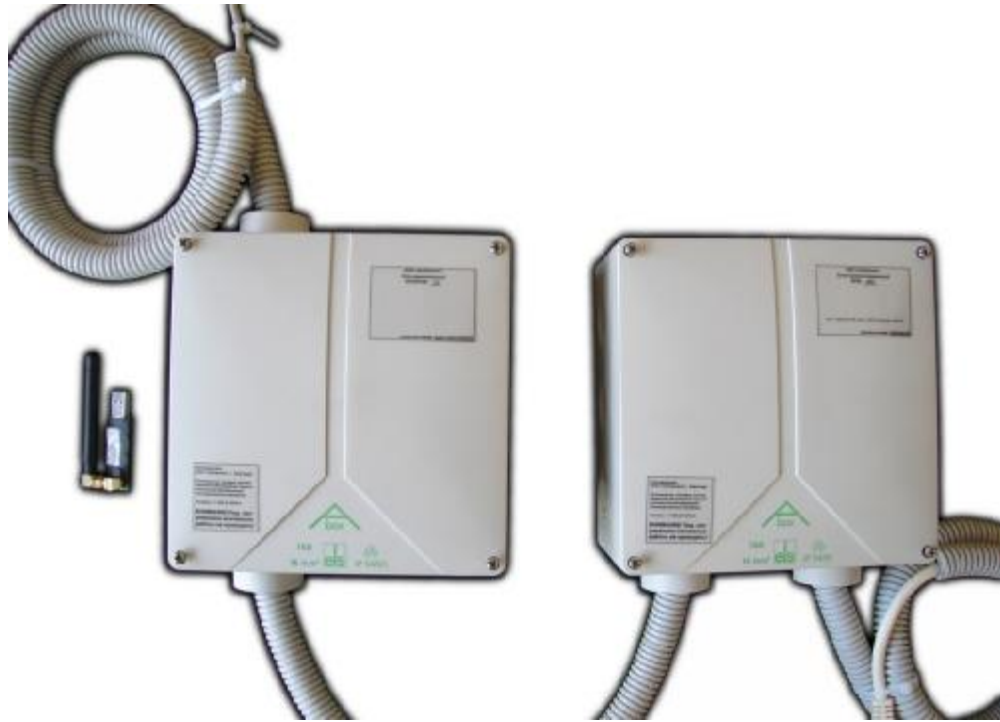
Рисунок 1. Общий вид ИВК VIAMonitor