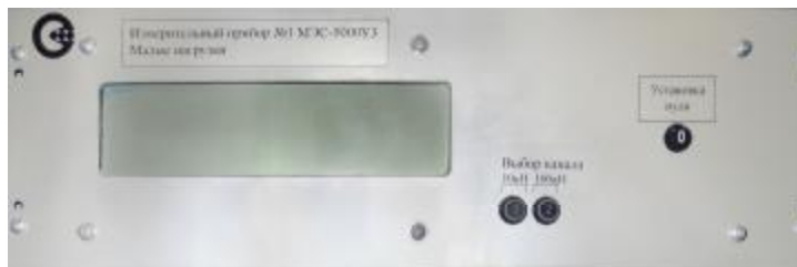
Рисунок 8. Передняя панель вторичного измерительного прибора на малые нагрузки