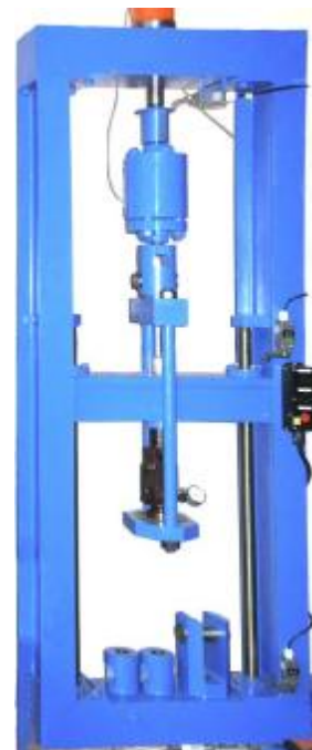
Рисунок 4. Силовой блок на 100 кН растяжение-сжатие