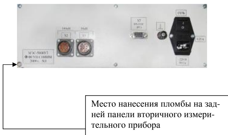
Рисунок 9. Схема пломбирования от несанкционированного доступа

В целях предотвращения несанкционированных вмешательств проводят пломбирование вторичного измерительного прибора после поверки. Схема пломбирования вторичного измерительного прибора представлена на рисунке 9.