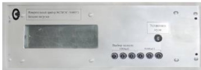
Рисунок 9. Передняя панель вторичного измерительного прибора на большие нагрузки

В целях предотвращения несанкционированных вмешательств проводят пломбирование вторичного измерительного прибора после поверки. Схема пломбирования вторичного измерительного прибора представлена на рисунке 9.