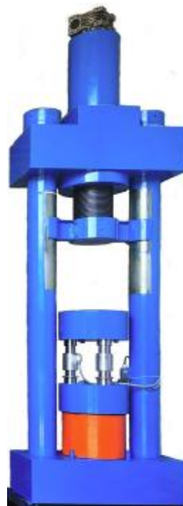
Рисунок 6. Силовой блок на 5000 кН сжатие