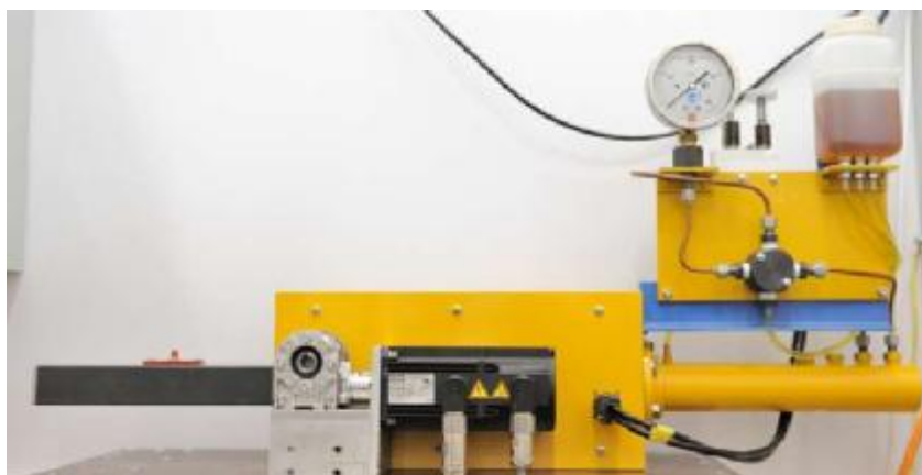
Рисунок 7. Электрогидравлическая станция