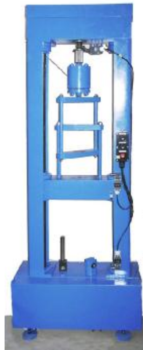
Рисунок 3. Силовой блок на 10 кН растяжение-сжатие