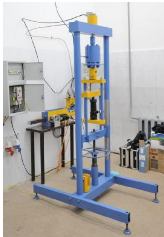
Рисунок 2. Общий вид МЭС-50У