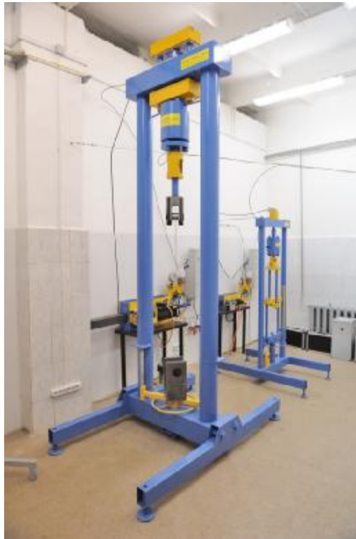
Рисунок 1. Общий вид МЭС-500У2