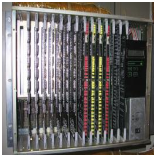
Рисунок 1- Общий вид аппаратуры

Микросхема M27C4002 (рис. 2) защищена от съема с места установки с помощью разрушаемой наклейки.