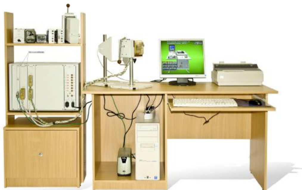
Рисунок 1. ИАПК РТУ Р

Метрологически значимые части внутреннего программного обеспечения и измеренные данные достаточно защищены с помощью специальных средств защиты от преднамеренных изменений.