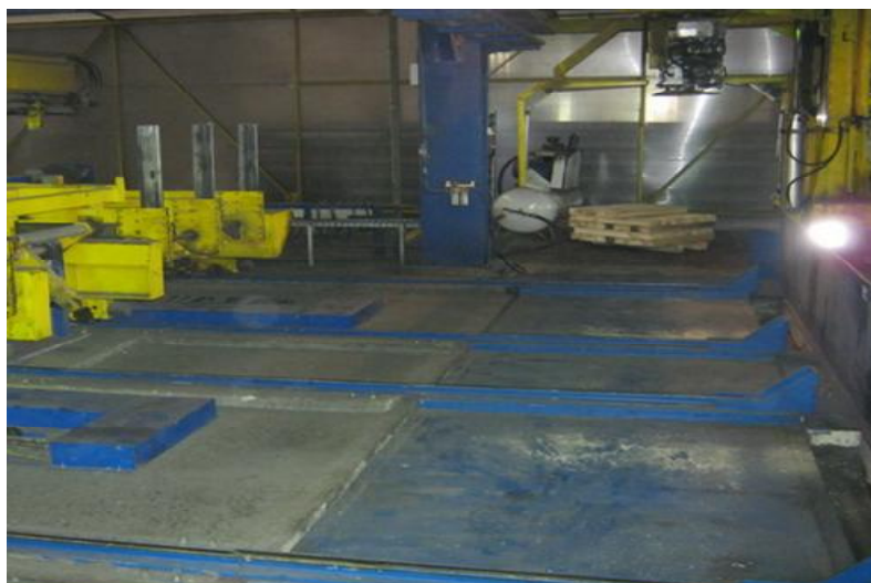
Рисунок 1 – Внешний вид весов