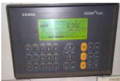
Рисунок 3 – Внешний вид весоизмерительного прибора