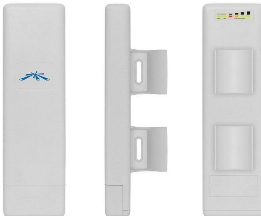
Рисунок 4 – Внешний вид АПД