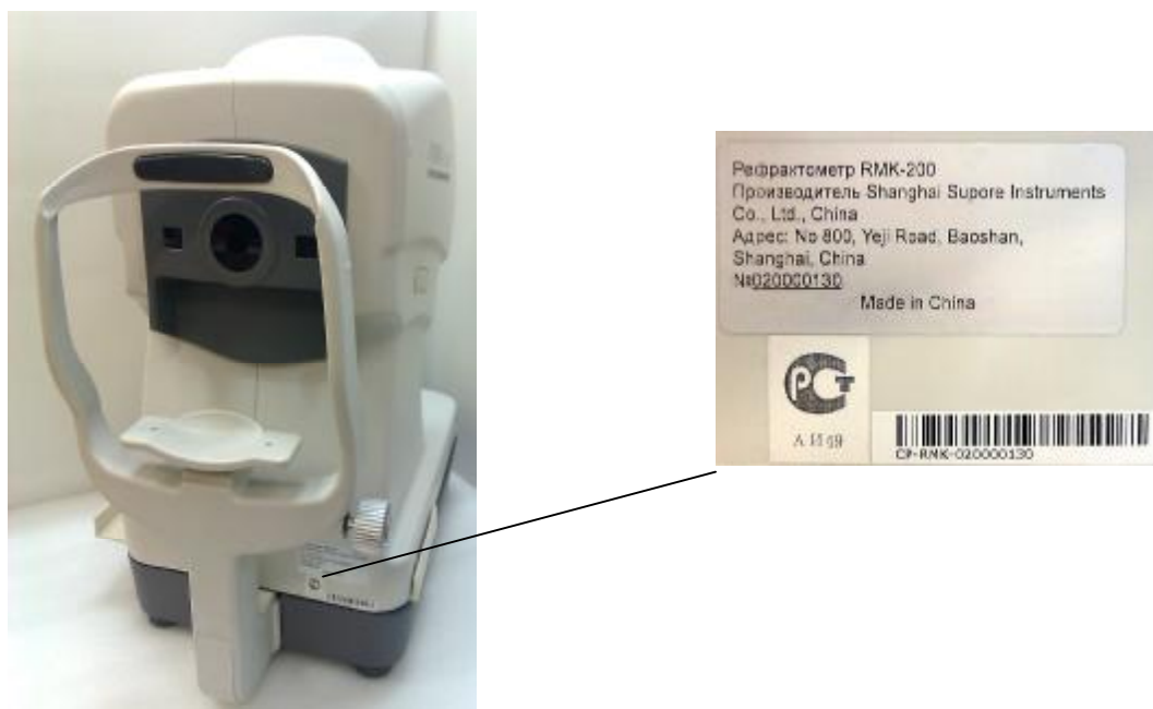
Рисунок 2 – Вид сзади и схема маркировки рефрактометра RMK-200.