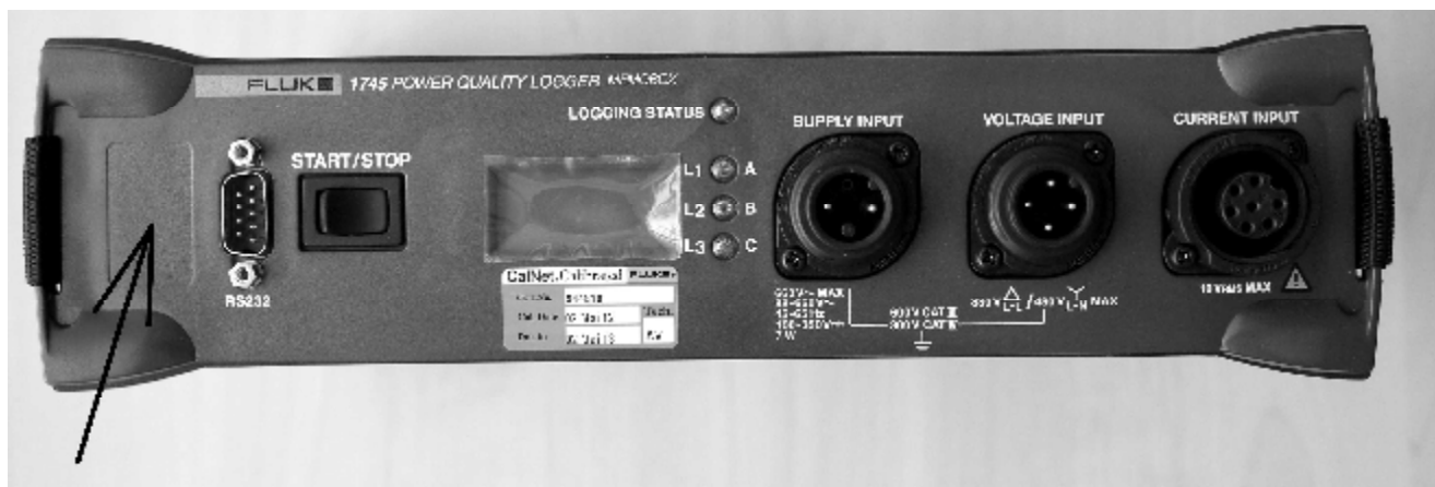
Рисунок 2. Внешний вид регистратора модели Fluke 1745, стрелкой показано место нанесения знака утверждения типа.

Модели Fluke 1744 и Fluke 1745 идентичны по метрологическим характеристикам и отличаются технической компоновкой. Внешний вид регистратора модели Fluke 1744 показан на рисунке 1. Внешний вид регистратора модели Fluke 1745 показан на рисунке 2.